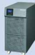
UPS - Type S Zonder batterijen