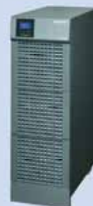
UPS - Type M Met batterijen