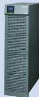
UPS - Type T Met batterijen