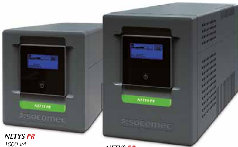
NETYS PR 1000 VA