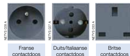
Fransen contactdoos Duits/Italiaanse contactdoos Britse contactdoos